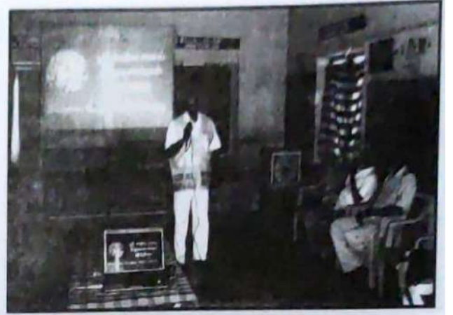
ஜமீன்கொல்லங்கொண்டான் கிராமத்தில் இயற்கை பேரிடர் விழிப்புணர்வு முகாம்.