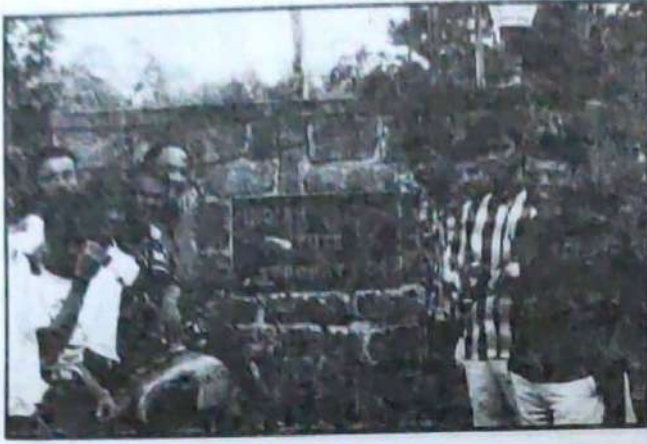
OBSERVATORY Indian Institute of Astrophysics Centre, Kodaikanal III B.Sc., (Physics) 22-7-2011.