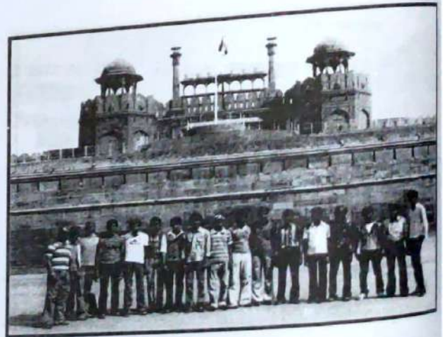
RED FORT, DELHI III B.A., Students, Dept. of History, ALL INDIA TOUR - Feb, 2012.