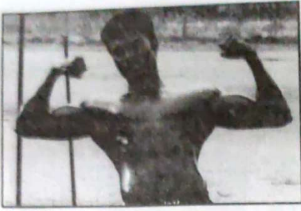
ராஜுக்கள் கல்லூரி ஆணழகன்