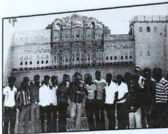
HAWA MAHAL, JAIPURA. III B.A., Students, Dept. of History, ALL INDIA TOUR - Feb, 2012.