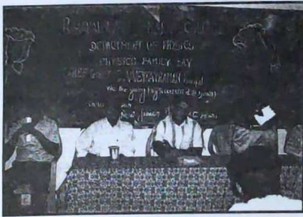
Welcome to First Year B.Sc., Physics Students PHYSICS FAMILY DAY on 4.8.2011 Felicitation by, Principal, HOD of Physics & Staff.