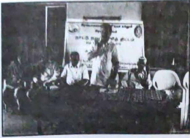
ஜமீன்கொல்லங்கொண்டான் கிராமத்தில் நாட்டு நலப்பணித்திட்ட முகாம் துவக்க விழா 25-12-2011.