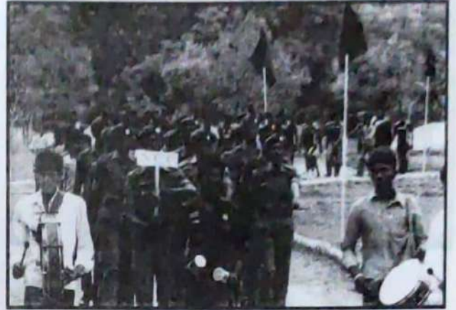
NCC Cadets Raliy