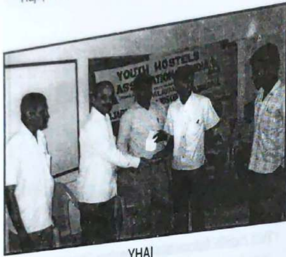
YHAI "World Tourism Day" 27.9.2011.