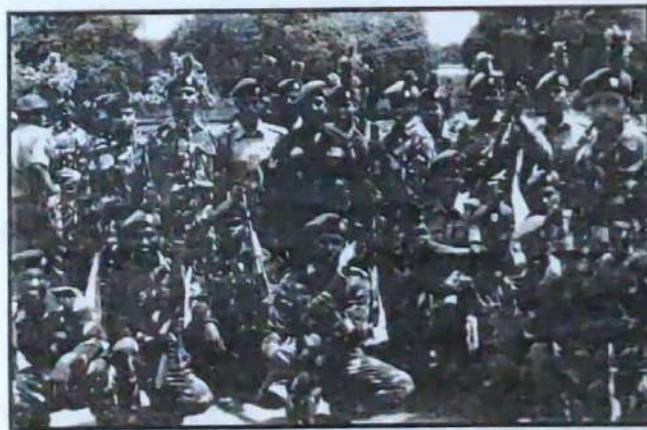
Army Attachment Camp Aug' 11 01.08.11 to 18.8.11 at Secundarbad.