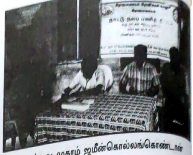
மருத்துவ முகாம் ஜமீன்கொல்லங்கொண்டான் கிராமத்தில் நடைபெற்றது.