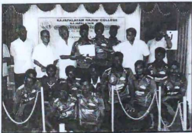
Winners of Cricket