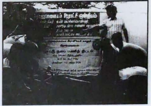
ஜமீன்கொல்லங்கொண்டான் கிராமத்தில் நாட்டுநலப்பணித்திட்ட களப்பணி.