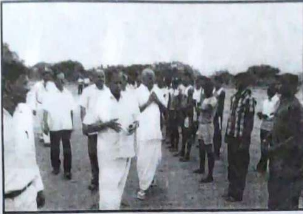
Our College President & Secretary with Athletes