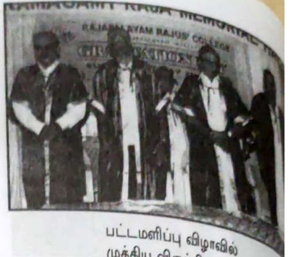
பட்டமளிப்பு விழாவில் முக்கிய விருந்தினர்கள்