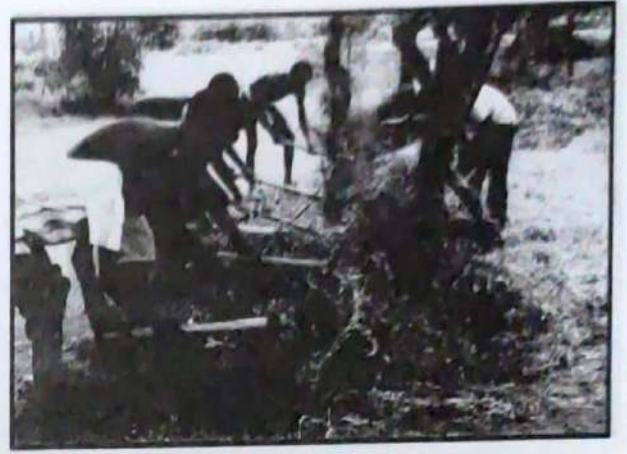
நாட்டு நலப்பணித் திட்ட மாணவர்கள் தேவதானத்திலுள்ள நச்சாடை தவிர்த்தருளிய சுவாமி திருக்கோவிலுள்ள முட்புதர்ச் செடிகளையும், புற்களையும் அப்புறப்படுத்தினர்.