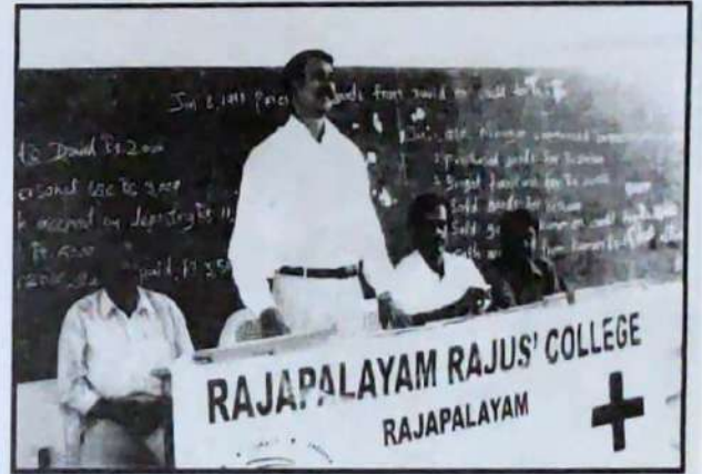
Two month Automobile Mechanism Training Camp Inaugural Function held on 28.07.2011.