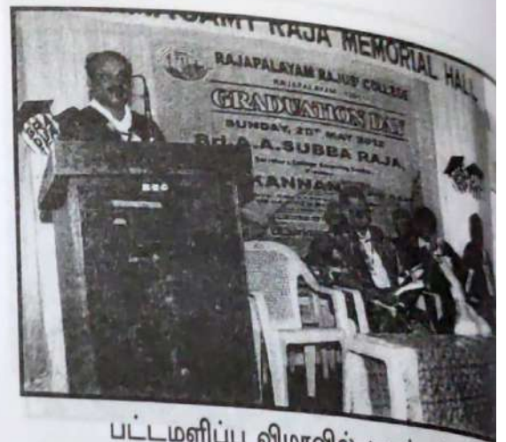
பட்டமளிப்பு விழாவில் முதல்வர் உரை