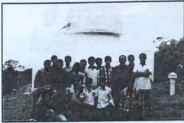
III B.Sc., Physics students visited the OBSERVATORY Indian Institute of Astrophysics Centre, Kodaikanal on 22.7.2011.