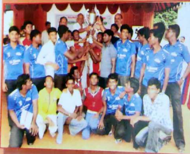
Sports Day Over All Championship Cup Nehru House B.Com / B.Com.,(CA) / B.Com.,(SF)