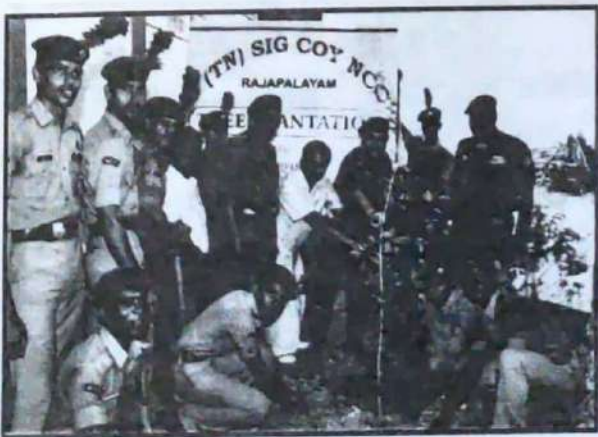
Social Service - Tree Plantation at Noorsigapuram. Date 16-03-12.