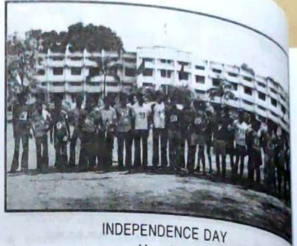
INDEPENDENCE DAY Marathon.