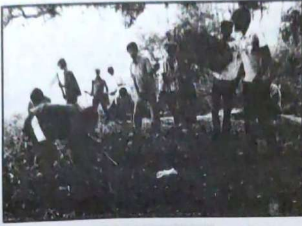
நாட்டு நலப்பணித் திட்ட மாணவர்கள் வடக்கு தேவதானத்திலுள்ள முருகன் கோவிலில் களப்பணியை மேற்கொண்டனர்.