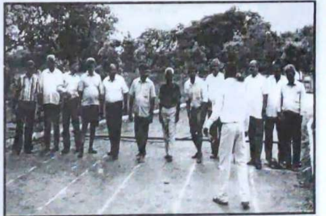
Teaching Staff preparing for 100 Meters