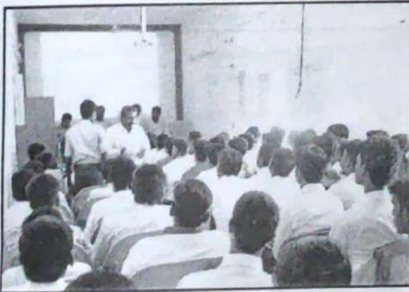
Placement Cell Campus Interview H.R. Team of URC Construction Company, Erode. Selecting Students at Campus Interview