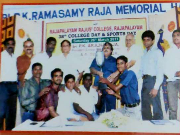
This Year (2010-2011) Intra - Collegiate Over all Championship Cup goes to White house BA / B.Sc.,

Principal District and Sessions Virudhunagar Dist.