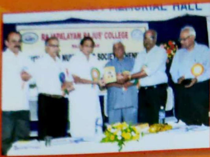
Inauguration and Release of SINS Journal