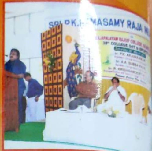
College Day Address By

Registrar, Madurai Kamaraj University - Madurai.