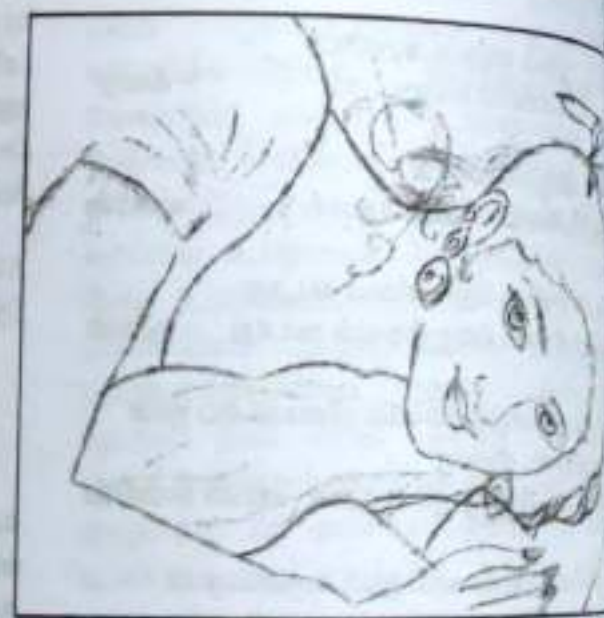
கண்ணின் கடைப்பார்வை கருதல்மீது கருட வீட்டல்