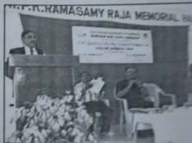
VAT National Seminar