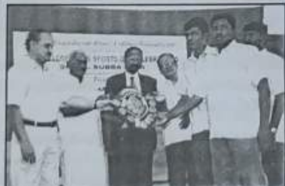
வினையாட்டுப் போட்டிகளில் மாணவர்கள் வென்று கிடைத்த கோப்பை மற்றும் கேடயத்துடன்