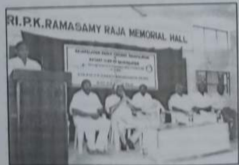
புதிதாக நான் கண்டது... Computer Hall திறப்பு விழா