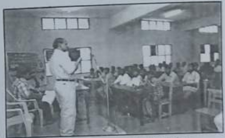
AIDS Awareness Programme Youth Red Cross Society