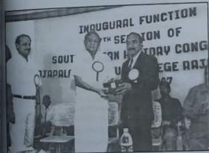
கல்லூரியில் நடைபெற்ற 27-வது தென்னிந்திய வரலாற்றுப் பேரவை மாநாட்டு திறப்புவிழை