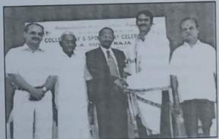
N.S.S. M.K. University Best N.S.S. P.O. Award for the year 2005 - 2006