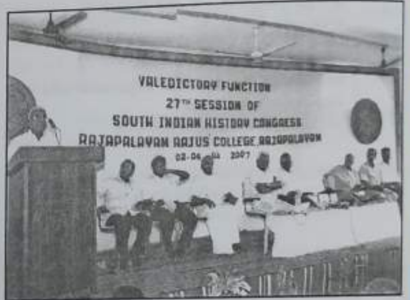
கல்லூரியில் நடைபெற்ற 27-வது தென்னிந்திய வரலாற்றுப் பேரவை மாநாட்டின் திறவு தான் நிகழ்ச்சிகள்