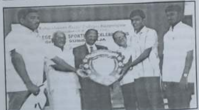
கல்லூரியில் தடைபெற்ற கல்லூரி நூள் மற்றும் விளையாட்டு விழா திறக்கிகள்