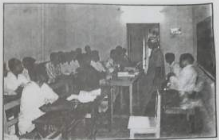
Certificate Course Feed Back Maths Students