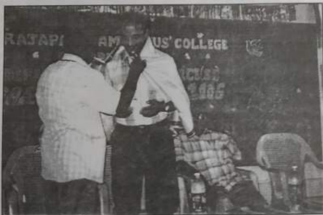
Farewell to the Final Year B.Com., (SF) Students.