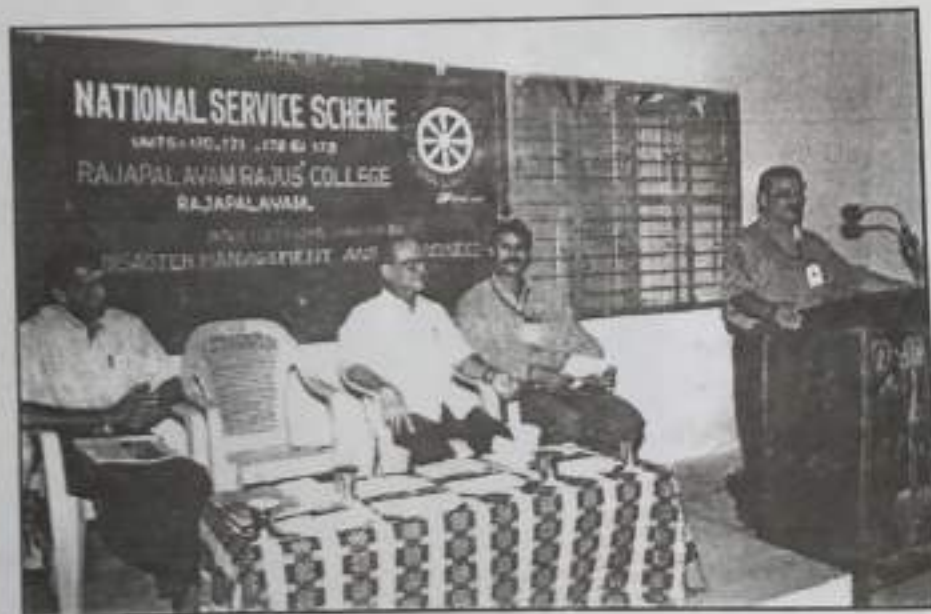
Inter - Collegiate Workshop on Disaster Management on 10.09.2005