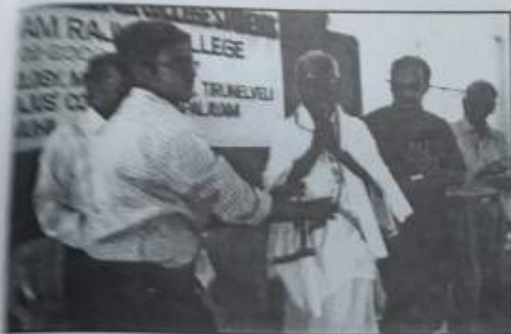
Seminar on Human Rights on 18.2.2006