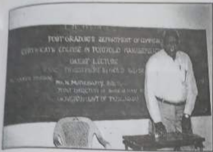
Certificate Course in Portfolio Management Guest Lecture on : "Investment in Gold and Silver"