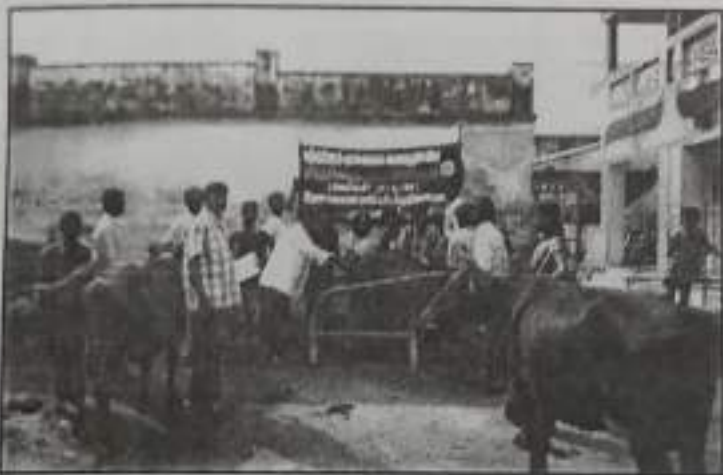
10 Day Veterinary Medical Camp at Gopalapuram.