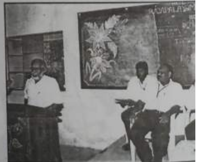
Inauguration of Tagore Literary Associa