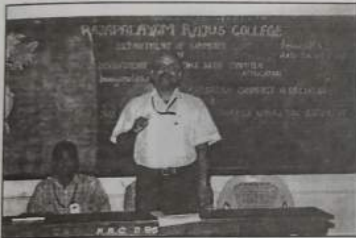
Inauguration of Commerce Association (SF)