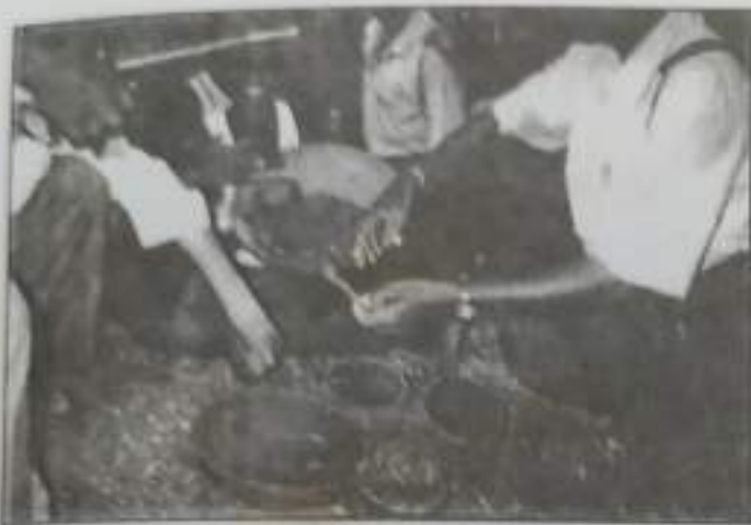
Field visit Um Bural with Pottery Ayar Dharmam