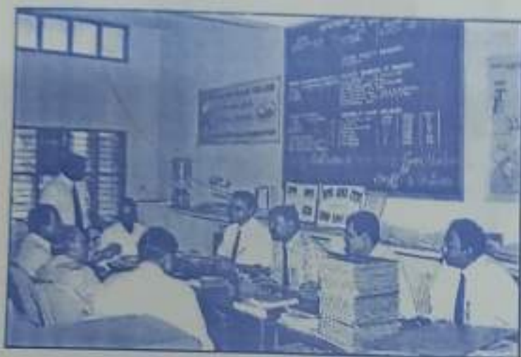
NAAC Peer Team interact with the Physics Faculty