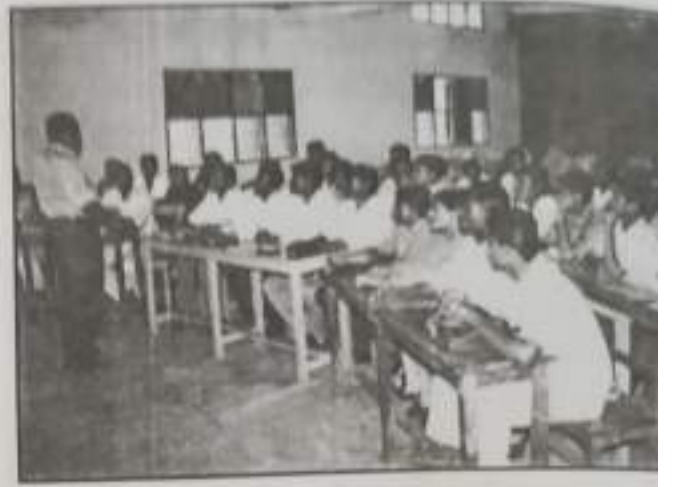
Certificate Course in Functional English - 2005