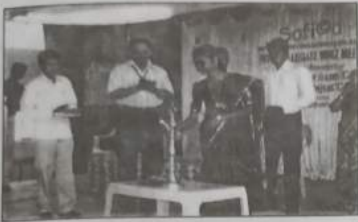
'Sofia' (Software Information Association) Inauguration