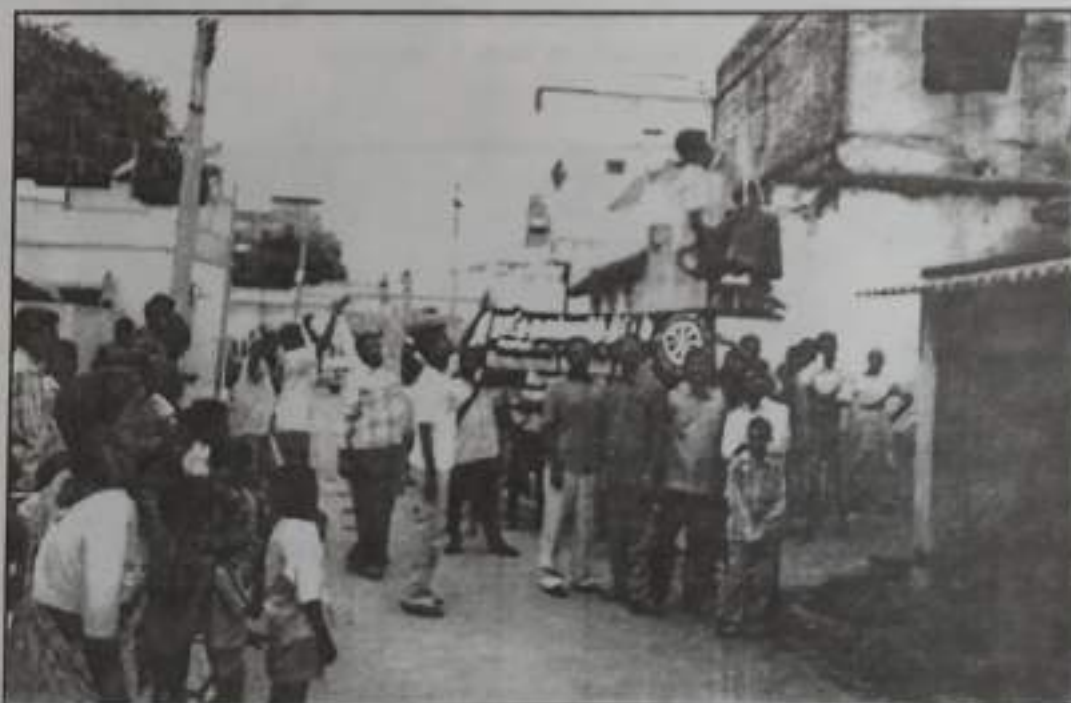
Disaster Preparedness and Rescue Methods - Demonstration at Sivalingapuram