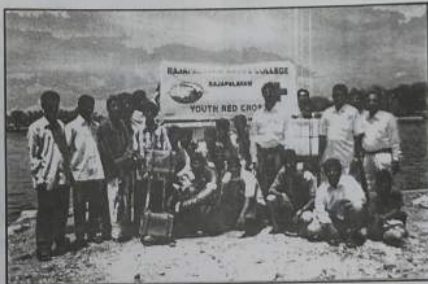
Disaster Management & Water Rescue Methods on 19 March 2006 at Thirumakkulam Tank, Srivilliputtur.