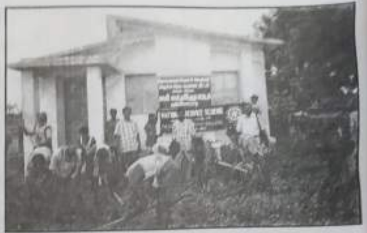
Field Work at Gopalapuram Special Camp of NSS.