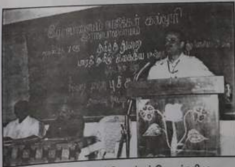
பாரதி தமிழ் இலக்கிய மன்றம் தொடக்கவிழா முதல்வர் சிறப்புரை.