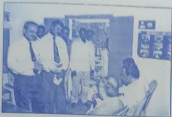
NAAC Peer Team interact with Youth Red Cross