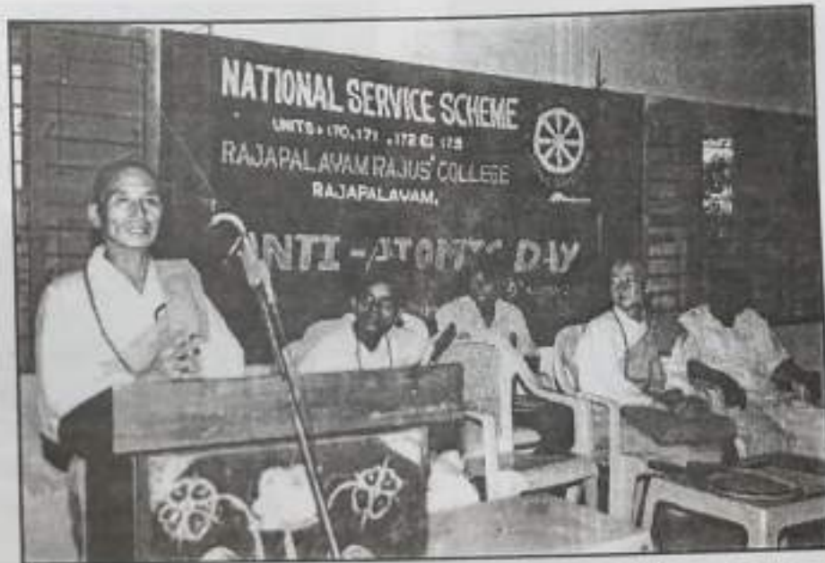
Anti Atomic Day - 9 August 2005 Saint Moshova Jshitham, Japan.