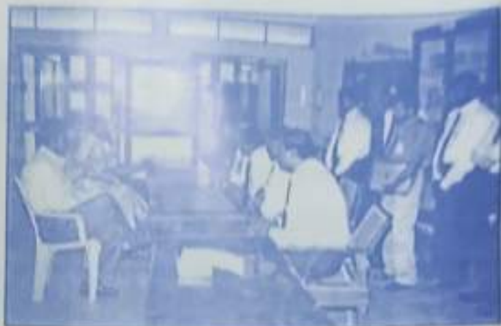
Peer Team interact with the Commerce Faculty