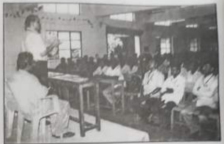
Consumer Rights and Awareness Workshop.