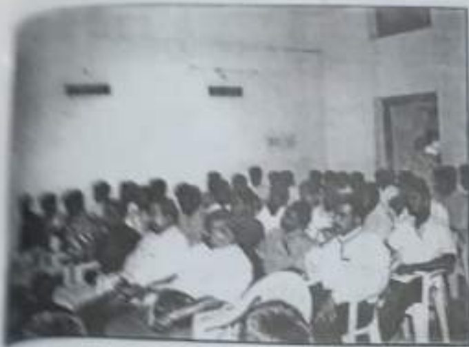
One day Training on "National Mission on Survey of Manuscripts" on 20.01.2006