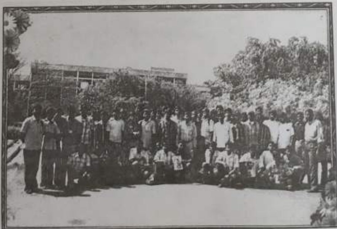
B.B.A., Students Industrial Visit at Dharani Sugars (P) Ltd.,