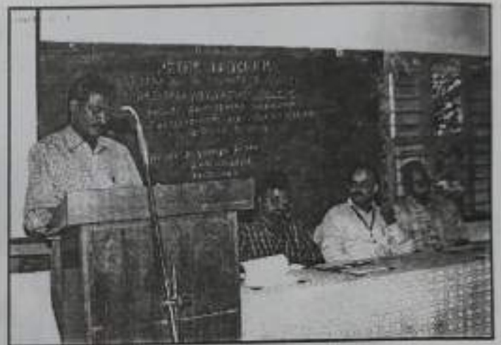
Faculty Development workshop to Researchers reganised by Peter Drucker Post Gradatue Commerce.