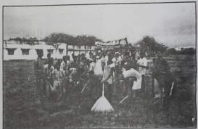
NSS Special Camp at Sivalingapuram.