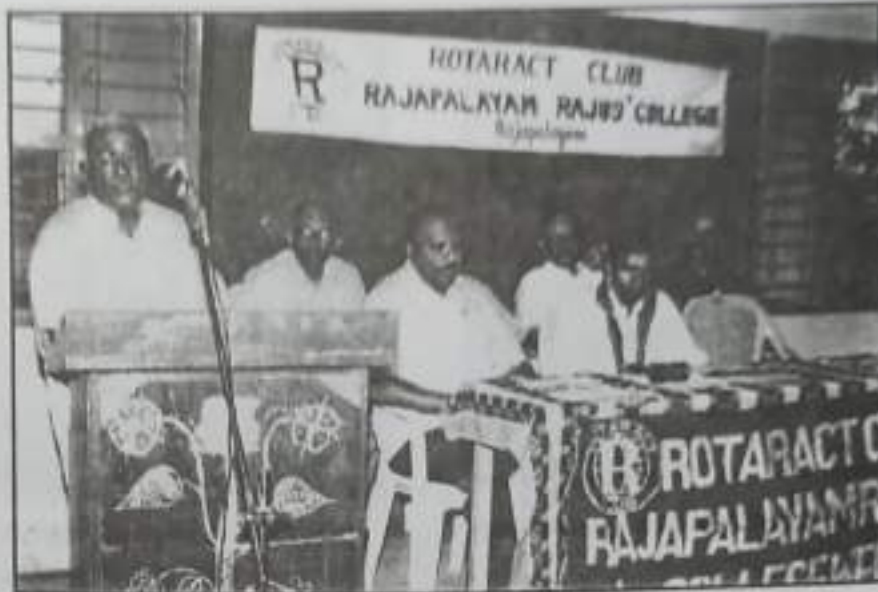
Rotaract Club Installation Function