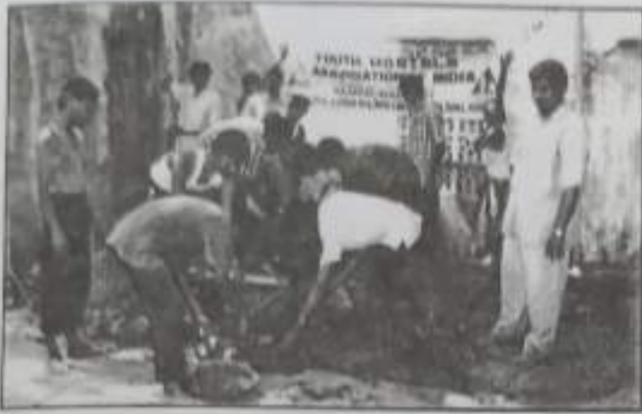
Youth Hostels Association of India Field work at Devadanam.