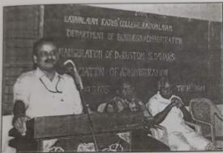
Inauguration of Rustom S. Davars Association of Administration.