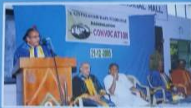
Convocation Address by Thiru A.K. Venkut Subramanian, I.A.S. (Retd)