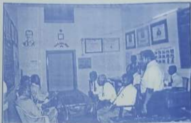
NAAC Peer Team interact with Maths Faculty