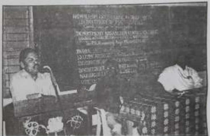
Inauguration of Certificate Course in Arithmetics