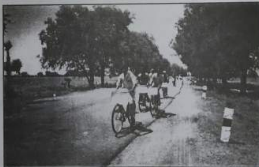
Cycle Rally from Rajapalayam to Gandhi Nikethan Ashram, T. Kallupatti.