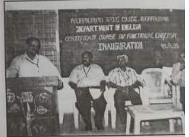
Inauguration of College offered Course "Functiona