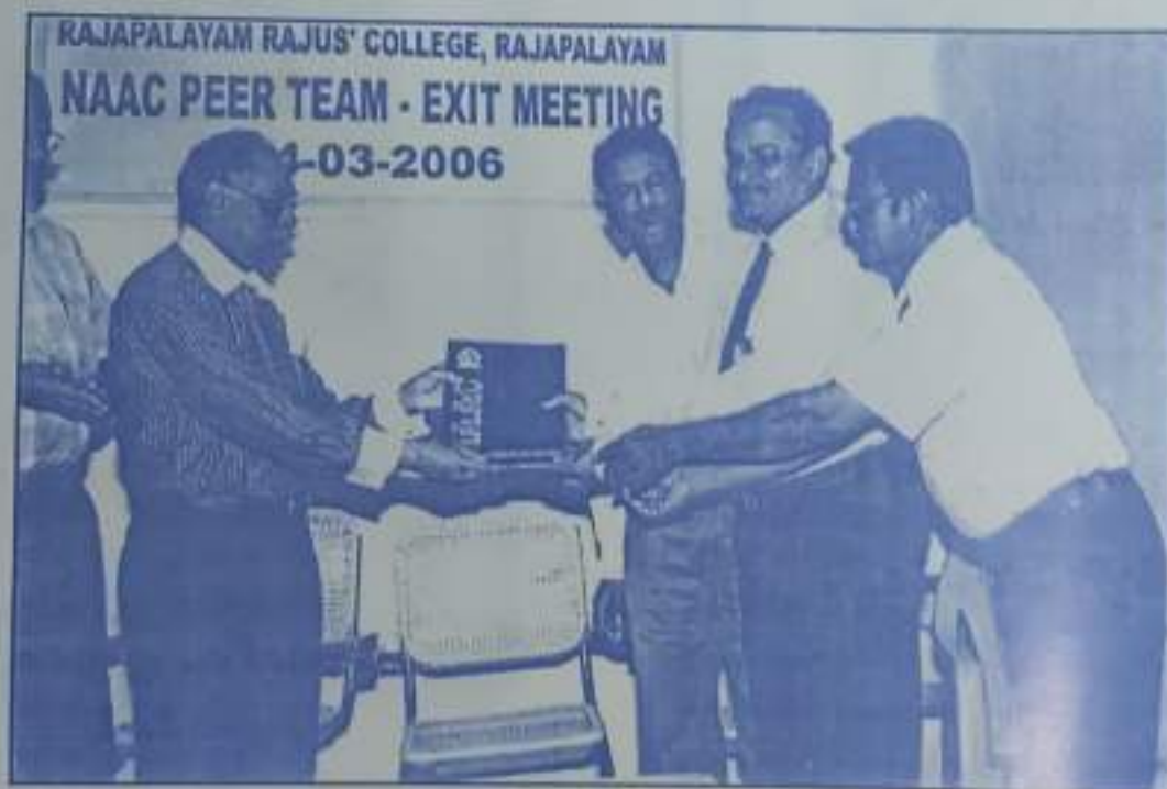
Principal receives the NAAC Peer Team Report