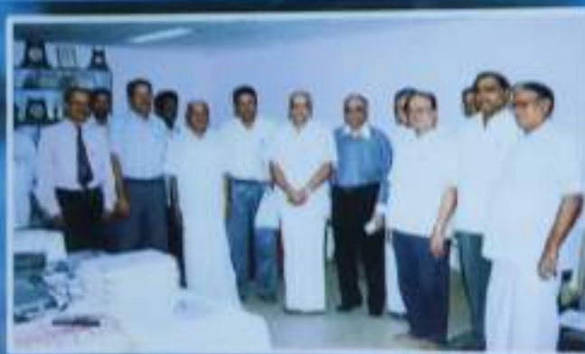
College Management Members with NAAC Team