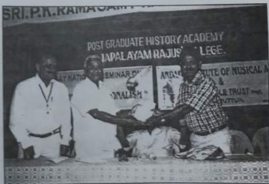
National Seminar on "Divinity and Nationalism" - Feb 11 & 12 2006