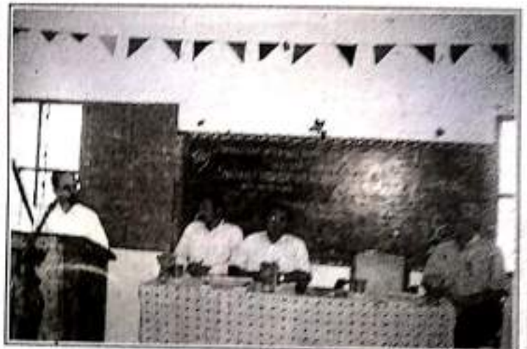
Seminar on Quality Management in Textile Industries