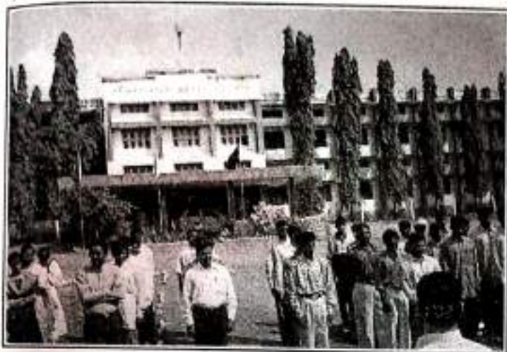
DISTRICT LEVEL STUDY CAMP PARADE