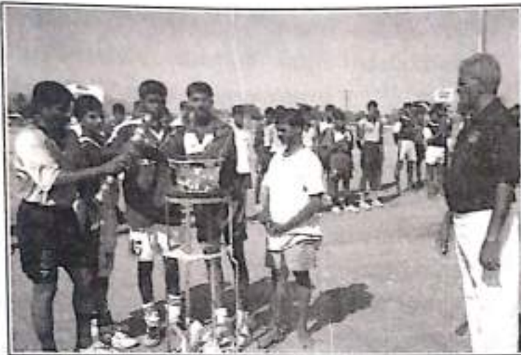
Lighting the Olympic torch