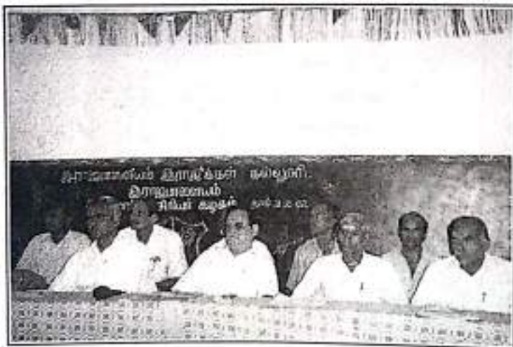
Office Bearers on the DAIS