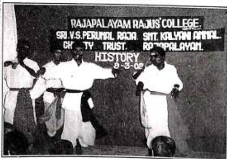
History Day - Dance by Our Students