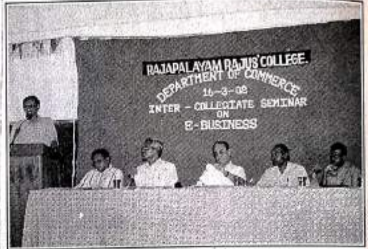
Seminar on E-BUSINESS