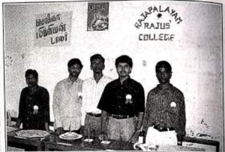
SFR Maths Exhibition Our Students Participate