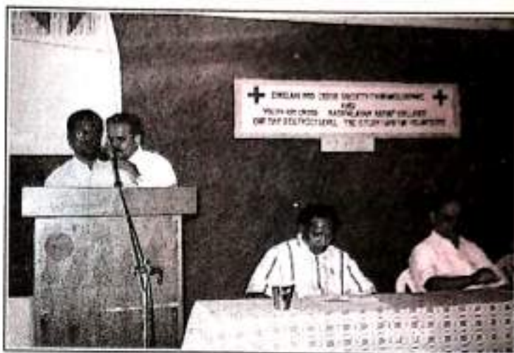
DISTRICT LEVEL STUDY CAMP INAUGURATION