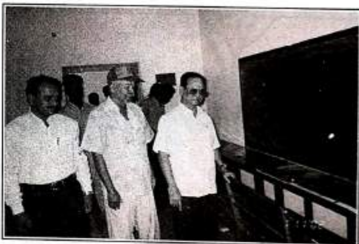
WILD-LIFE PHOTO EXHIBITION