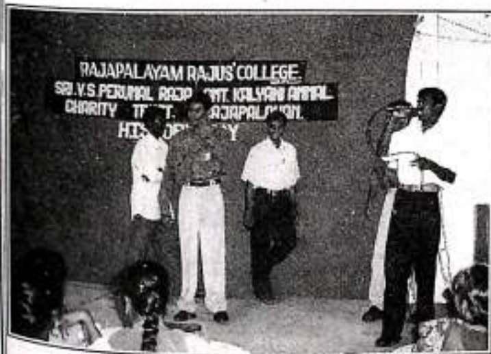
History Day - A Skit by Our Students