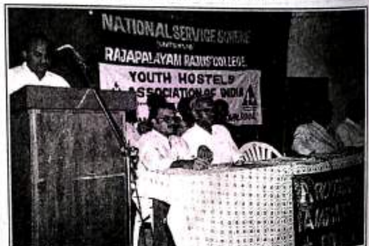
Rotary Club President Addresses