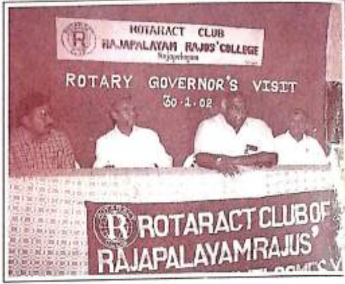
Rotary Governor's Visit