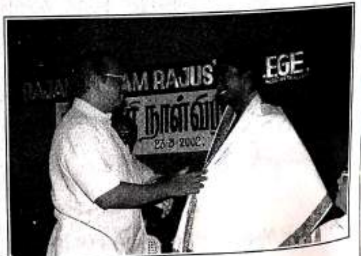
Honouring the Best Student