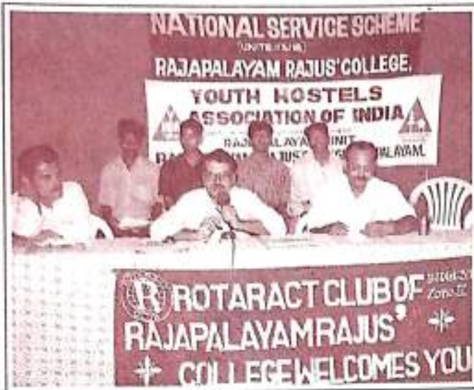
National Youth Day