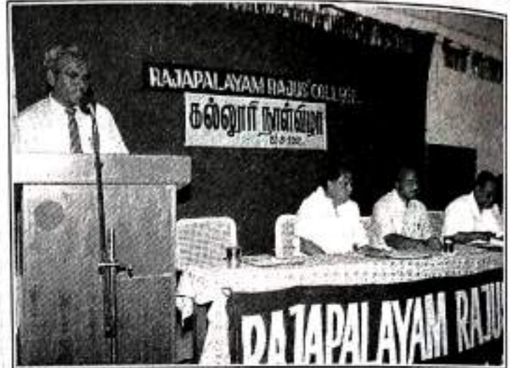
Principal Presents the Annual Report