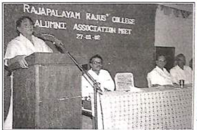
Alumini Assn. Meeting