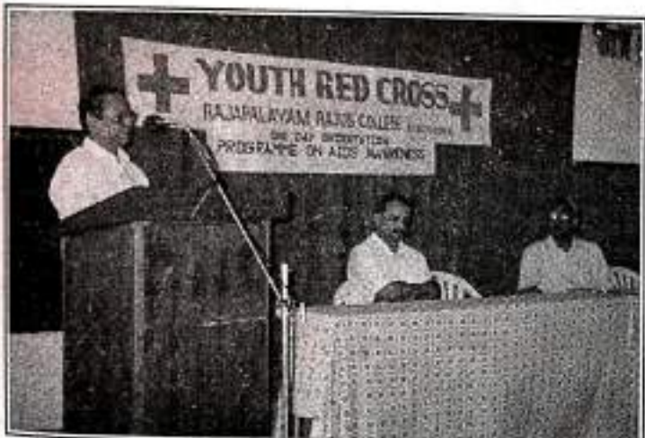
YRC AIDS AWARENESS PROGRAMME