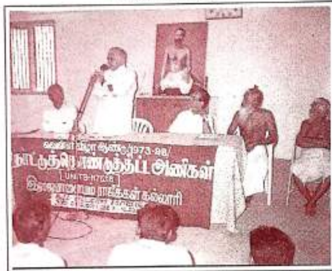
Inaugural Function of Special Camp at Ayyanarkoil