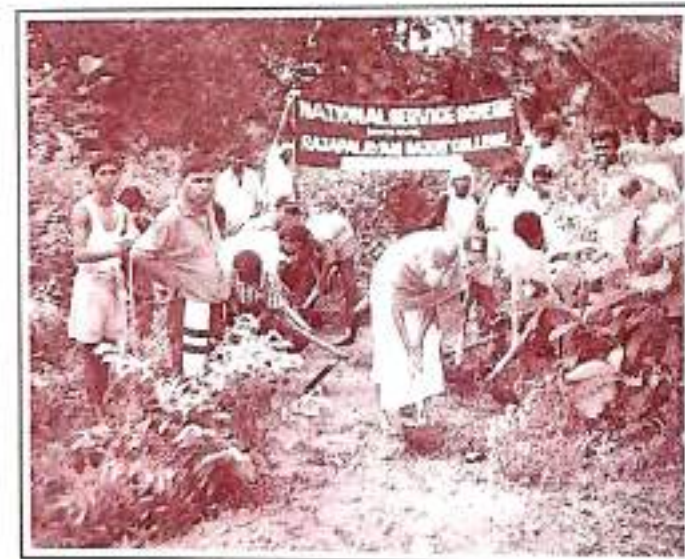
Field work at Special Camp