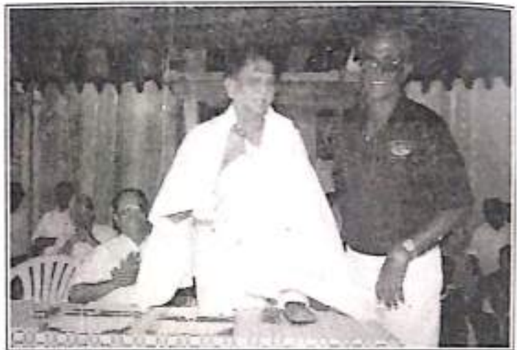
Honouring the President