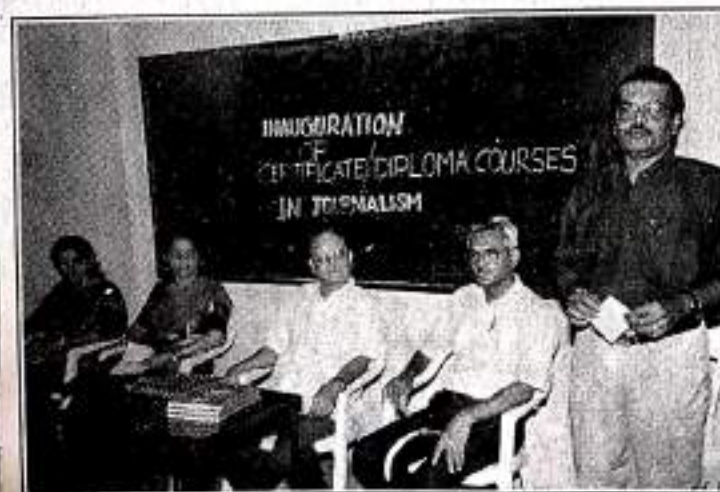
Journalism Courses Inauguration