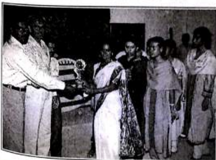
Best Performance Award to SFR College