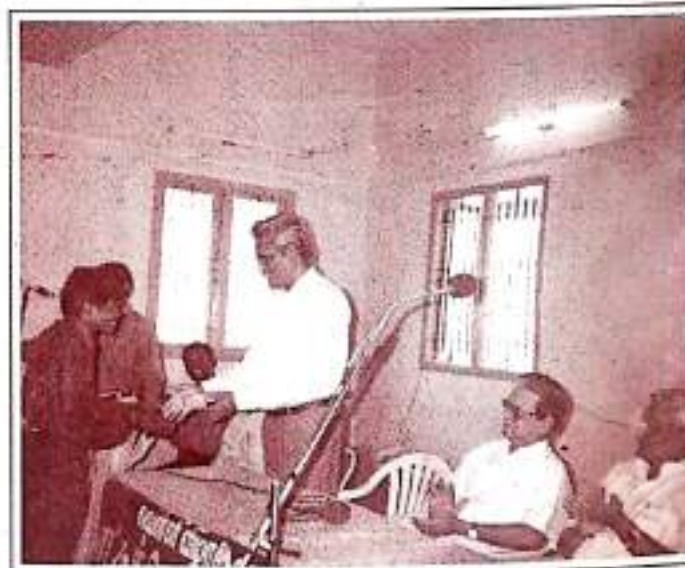
Prize Distribution at Special Camp