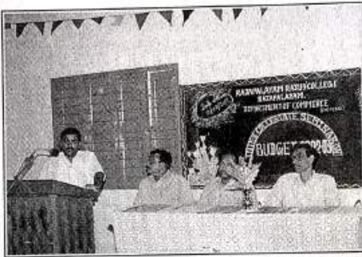
Seminar on BUDGET 2002