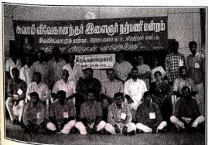
BLOOD DONATION CAMP